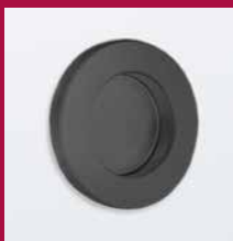
GRIFFMUSCHEL M 70 70 mm