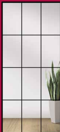
TYP 12 KLARGLAS