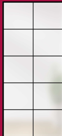
TYP 10 SATINATO