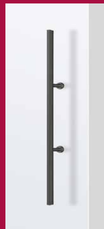
GRIFFSTANGE eckig schmal 420 mm Länge 700 mm Länge