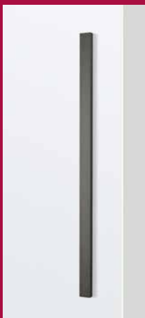
GRIFFLEISTE beidseitig 360 mm Länge 600 mm Länge

Passend zu den verschiedenen Glasschiebetüren der LinesPlus-Kollektion sind die innovativen Griffe erhältlich. Egal ob Griffstange, Griffmuschel oder eine Kombination aus Griffstange und Griffleiste, wir finden die passende Griffeinheit für Sie. Diese sind natürlich farblich perfekt auf die Glastüren und den Schiebetürbeschlag abgestimmt.