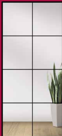
TYP 8 KLARGLAS