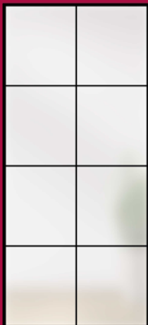
TYP 8 SATINATO