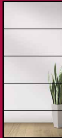
TYP 5 KLARGLAS