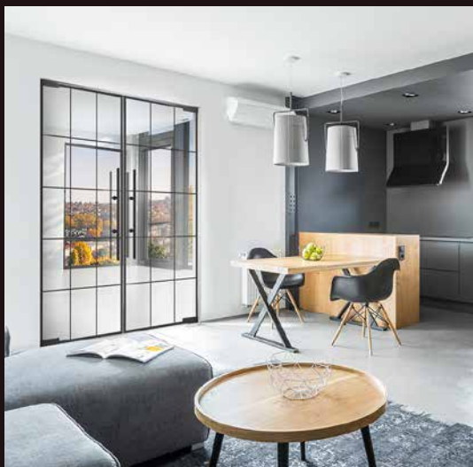
Stylischer Industrielook für moderne, elegante oder klassische Einrichtungsstile.