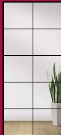
TYP 10 KLARGLAS