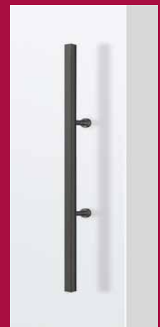
GRIFFSTANGE eckig breit 420 mm Länge 700 mm Länge