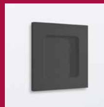
GRIFFMUSCHEL M 60 64 mm