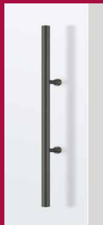
GRIFFSTANGE rund 420 mm Länge