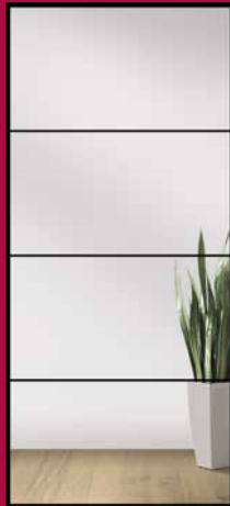
TYP 4 KLARGLAS