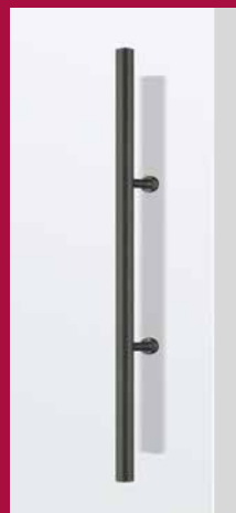
GRIFFSTANGE rund 700 mm Länge